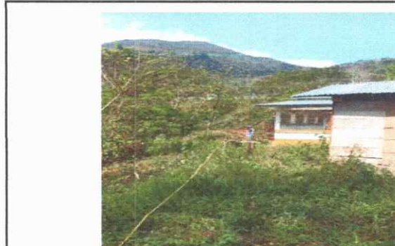
foto 6: parte trasera del predio del centro educativo, se puede observar la cocina - comedor.

Observación: Si es necesario se pueden agregar hojas adicionales y actualizar el número de hojas.